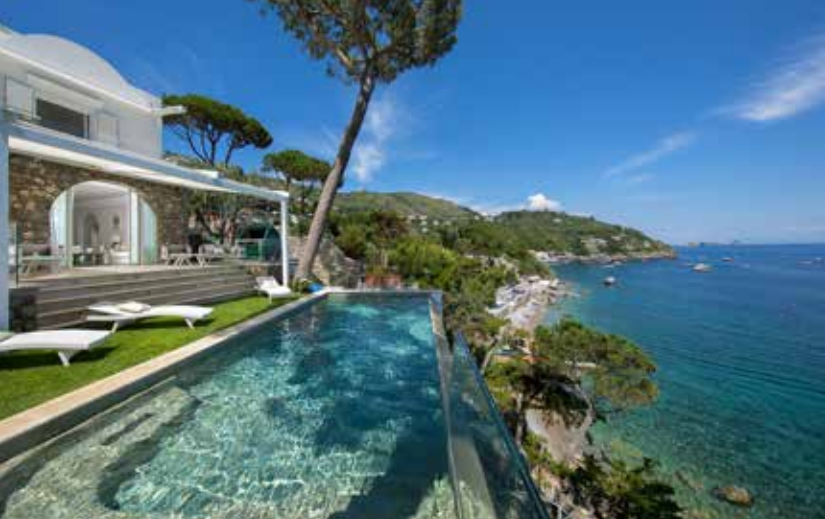
Villa Ibisus Nerano Luxury Villa in Amalfi Coast