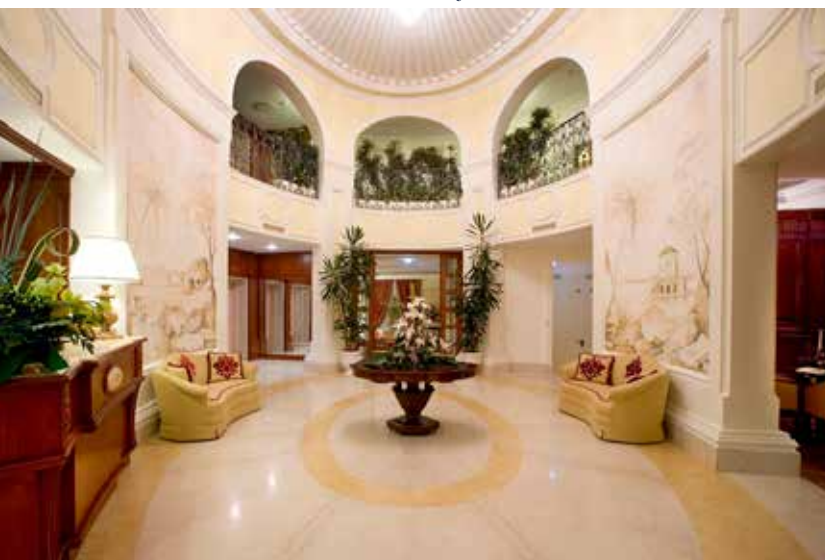
Palazzo Alabardieri Hotel De Charm in Naples